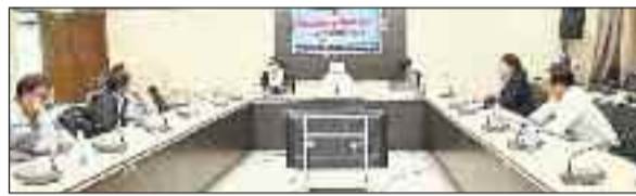
कलेक्टर कार्यालय में आयोजित बैठक।

विदित हो कि विशेष संक्षिप्त पुनरीक्षण आर्हत तिथि 1 जनवरी के परिपेक्ष्य में जिले में मतदाता सूची