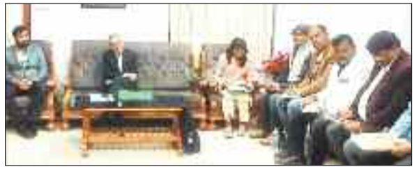
विश्रामगृह में समीक्षा बैठक लेते संयुक्त सचिव।